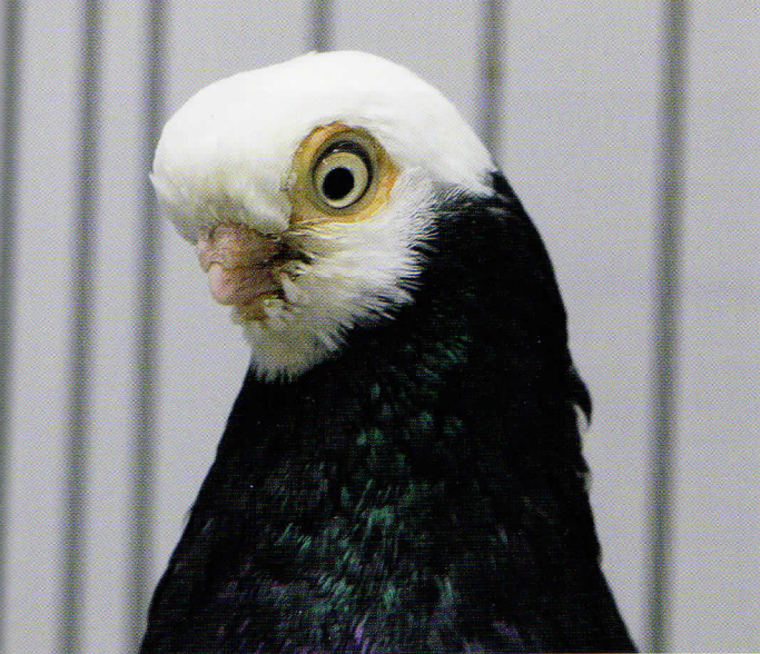
Kopstudie van een mooie zwarte, oograndjes mogen iets fijner en de snavel staat er wat recht in.