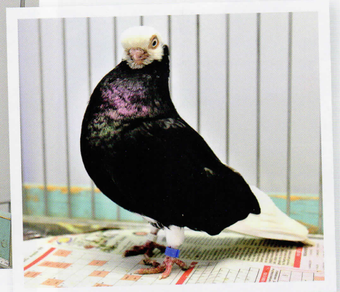
Deze zwarte kan wat korter en de vleugels kunnen wat strakker gedragen.