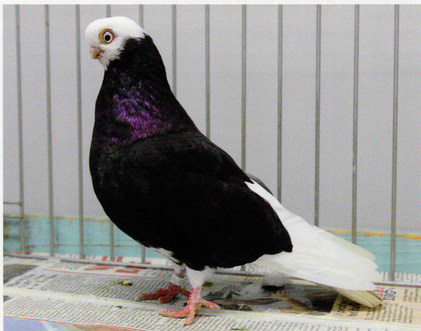
Bij deze zwarte is het gewenste kuiltje op de bovenkop goed zichtbaar!

De bovenkop moet vlak zijn, met in het middel een klein kuiltje waardoor de achterhoofdsknobbel duidelijk geaccentueerd wordt en goed zichtbaar moet zijn. Van boven bezien moet de kop overal even breed zijn. De snavel is zeer kort en dik, naar beneden gericht. Een denkbeeldige lijn van de snavel loopt door of net onderlangs het oog.