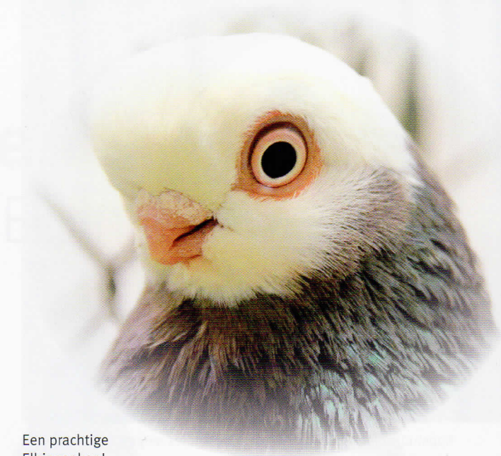
Een prachtige Elbinger kop!