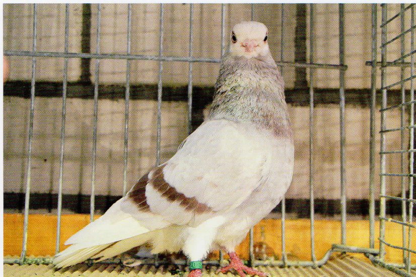
Een roodsilver, let op de mooie brede kop en sterke snavel.