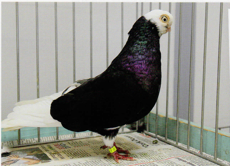
Ook bij deze zwarte een wat beter afgedekte rug en de snavel staat er wat recht in.

een probleem is. Het grootbrengen van jongen met een normale snavel door 'kortsnavels' gaat overigens wel weer goed! Wanneer we tegenwoordig een collectie kortsnavels op tentoonstellingen zien is het opvallend dat ze nu, in tegenstelling tot pakweg een jaar of 30 geleden, steeds in een prima conditie worden voorgebracht. Het zijn gelukkig levenslustige en vitale duifjes en dat geeft deze rassen natuurlijk alle bestaansrecht.