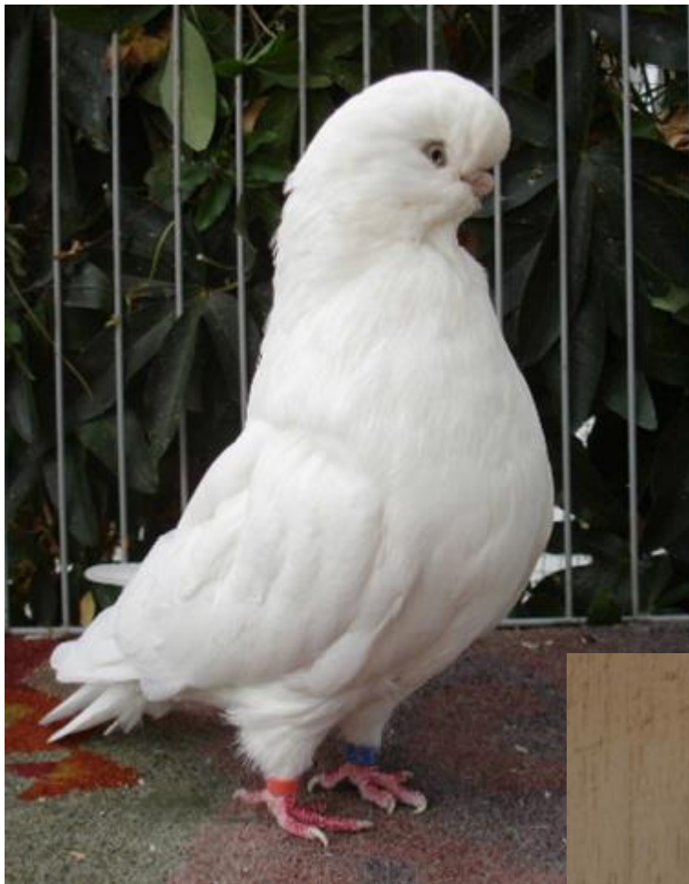
Links: Een Langvoorhoofd Tuimelaar, wit. Eigenaar Leo Hulst, Spanje.

Wat mij vooral aantrok, toen ik de eerste exemplaren op een tentoonstelling tegenkwam, was het algehele type; mooi diep gesteld met een wat naar achteren gedragen hals en die geweldige kop die aan alle kanten rond leek. Zoals eerder aangegeven heb ik mij de laatste 20 jaar praktisch alleen maar bezig gehouden met de witten en de witkoppen.