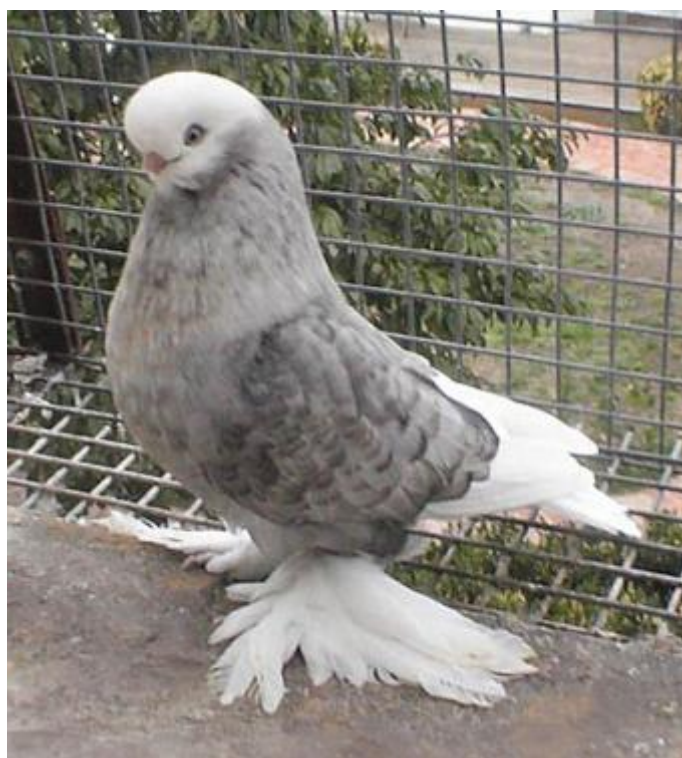
Linksonder: LVT, zwart witkop, voetbevederd, van Felice Esposito, Australië.