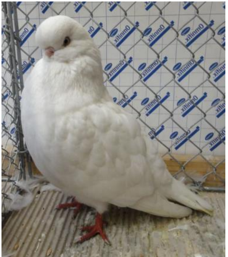
Rechts: Langvoorhoofd Tuimelaar, wit van Gustav Staack, Duitsland.