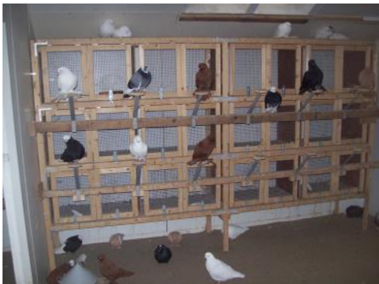
Links: Broedhokken, hier achterin het open front hok, zijn nu nog gesloten. De duiven nemen plaats op de vrijstaande zitplanken, waardoor optimale privacy en zo min mogelijk beschadiging van de voetbeveering optreedt.

Meestal begint voor mij het fokseizoen omstreeks half maart. Ongeveer 6 weken van tevoren scheid ik de doffers van duivinnen. Dat komt voor de meeste fokkers wat vreemd over, maar mijn ervaring is, dat als je bijvoorbeeld direct na het kweekseizoen de dieren scheidt, er veel minder "leven" inzit bij zowel de doffers als de duivinnen. Ze zitten als het ware te treuren, kortom als je ze langer samen laat, zijn ze actiever en levendiger van aard.