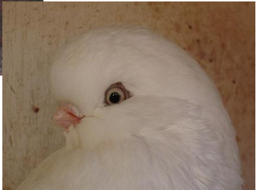
Onder: Kopstudie van een Langvoorhoofd Tuimelaar, wit, duivin.

Meestal begint voor mij het fokseizoen omstreeks half maart. Ongeveer 6 weken van tevoren scheid ik de doffers van duivinnen. Dat komt voor de meeste fokkers wat vreemd over, maar mijn ervaring is, dat als je bijvoorbeeld direct na het kweekseizoen de dieren scheidt, er veel minder "leven" inzit bij zowel de doffers als de duivinnen. Ze zitten als het ware te treuren, kortom als je ze langer samen laat, zijn ze actiever en levendiger van aard.