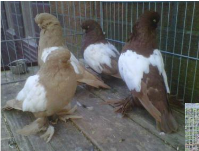
Links: LVT voetbevederd, rood- en geelwitschilden van Tony Braid, Engeland.

Langvoorhoofd Tuimelaars zijn op zich zeer straffe broeders en kunnen ook een langsnavelige duif perfect grootbrengen. Ieder paar Langvoorhoofd Tuimelaars brengt minimaal één jonge voedsterduif groot.