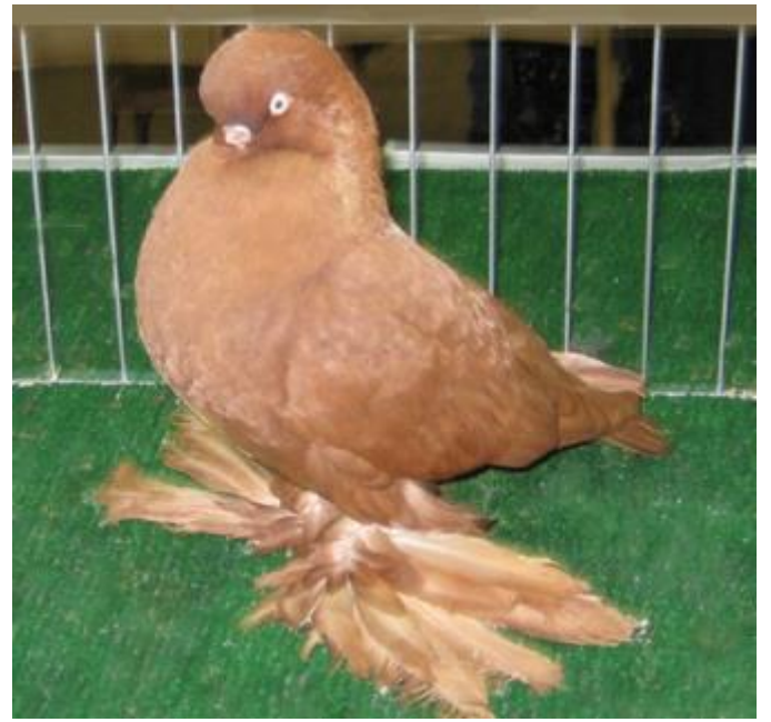
Boven: LVT, rood witschild, voetbevederd, van Tony Braid, GB.