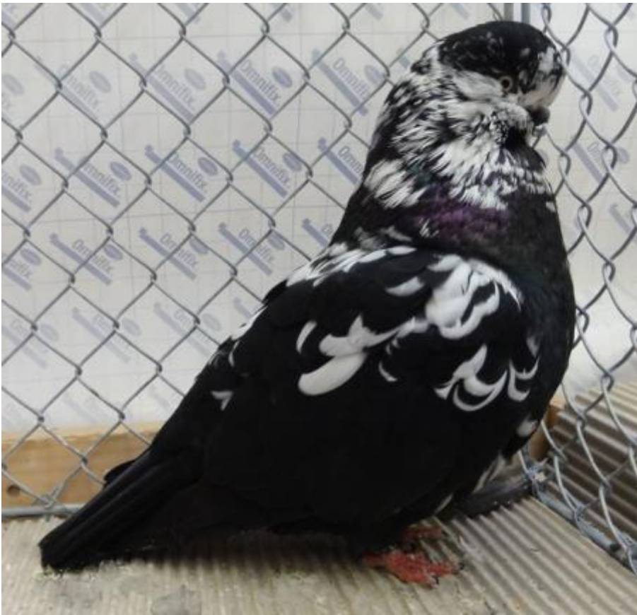
Links: LVT, zwartgetijgerd, van Gustav Staack, Duitsland.

(Bij baldheads moeten de kop, de slagpennen, de staart en het onder- en bovenstaartdek wit zijn). De rest van het lichaam moet gekleurd zijn. De witte koptekening en slagpennen zijn er redelijk eenvoudig op te fokken; het grootste probleem is meestal de staart, waar nogal eens wat gekleurde staartpennen tussen zitten. Een ander veel voorkomend probleem is het fokken van donkere ogen. Mijn ervaring is, dat de jongen met de beste kop- en snavelkwaliteit, ook vaak 1 of 2 donkere ogen hebben. Dit kan op den duur zeer frustrerend werken, maar als je