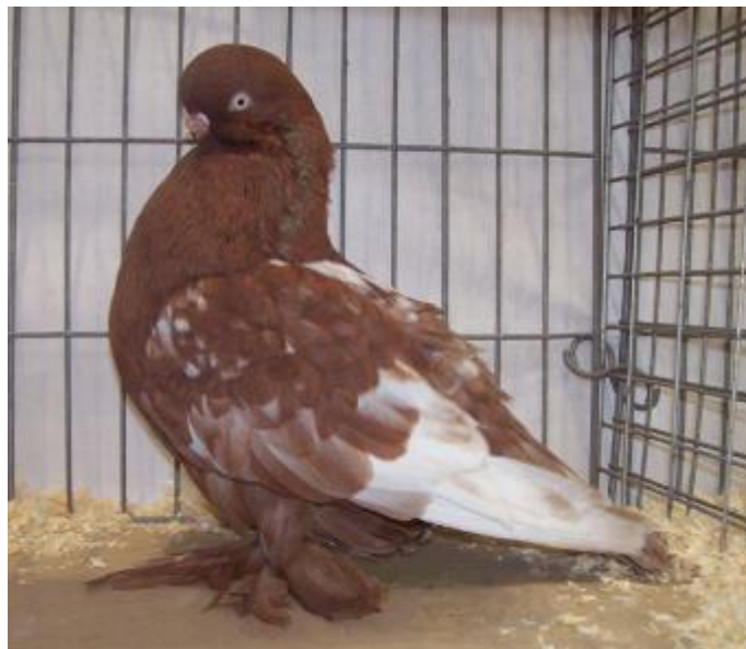
Rechtsboven: LVT, voetbevederd, aoc, tijdens NPA-show in Pickering, GB.