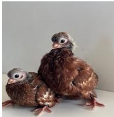
Jonge Stettiners rood