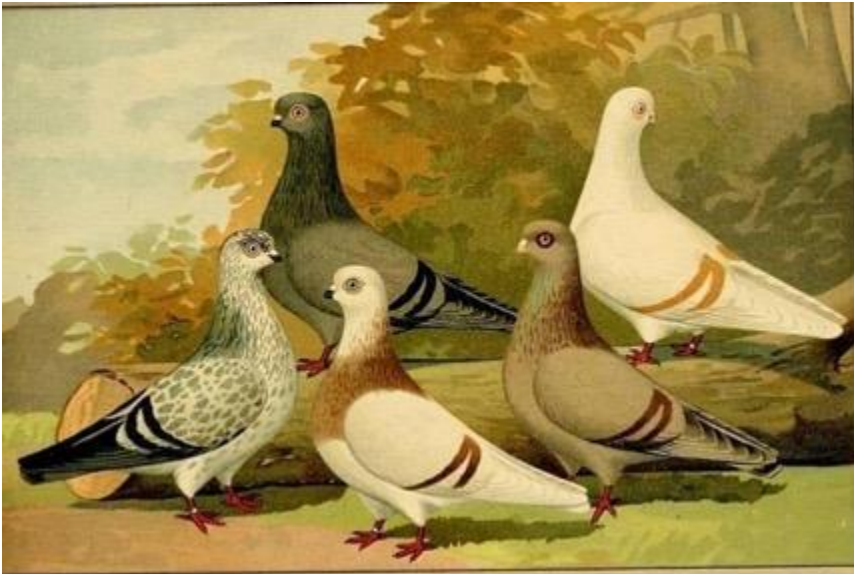
Tekening van internet. Onbekende auteur.